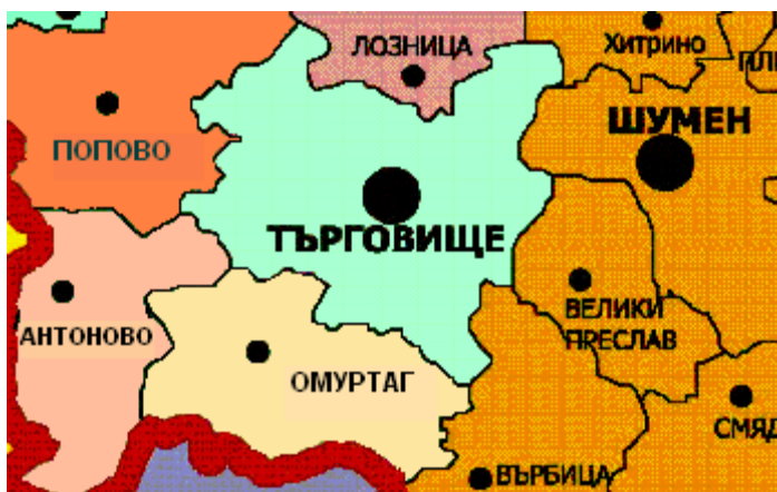
Фиг. 1. Община Търговище

Община Търговище е разположена в североизточната част на Република България, в източната и платовидна подобласт на Дунавската равнина и съобразно административното деление на страната попада в състава на Област Търговище. Общата територия на общината е 840,5 кв. км.