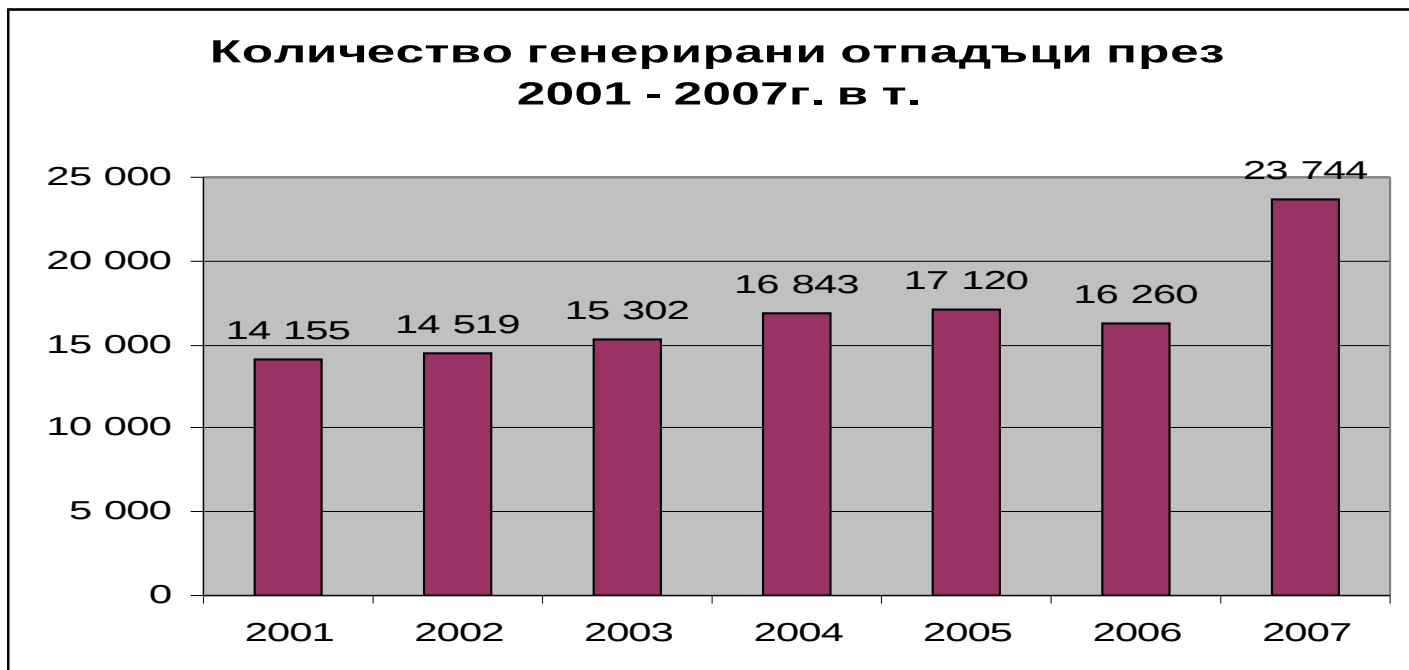
Фиг.2. Количество генерирани отпадъци