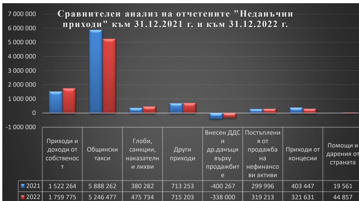
Графика № 1

Основен местен приходоизточник за общините е „Такса битови отпадъци“. Към 31.12.2022 г. приходите отчетени по §§27-07 „Такса битов отпадък“ са 4 629 202 лева, което е 127.43 % изпълнение спрямо уточненият план. В Графика № 2 е представен сравнителен анализ на ставката и събираемостта на приходите от тази такса.