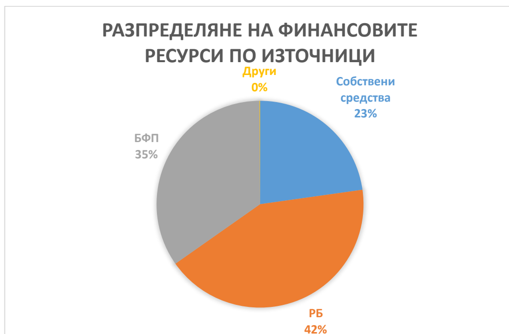
Фигура 2: Разпределяне на финансовите ресурси по източници

Основни финансови инструменти за изпълнението на ПИРО за 2022 г. са средствата от общинския и държавния бюджет и европейските фондове от програмен период 2014-2020 г.